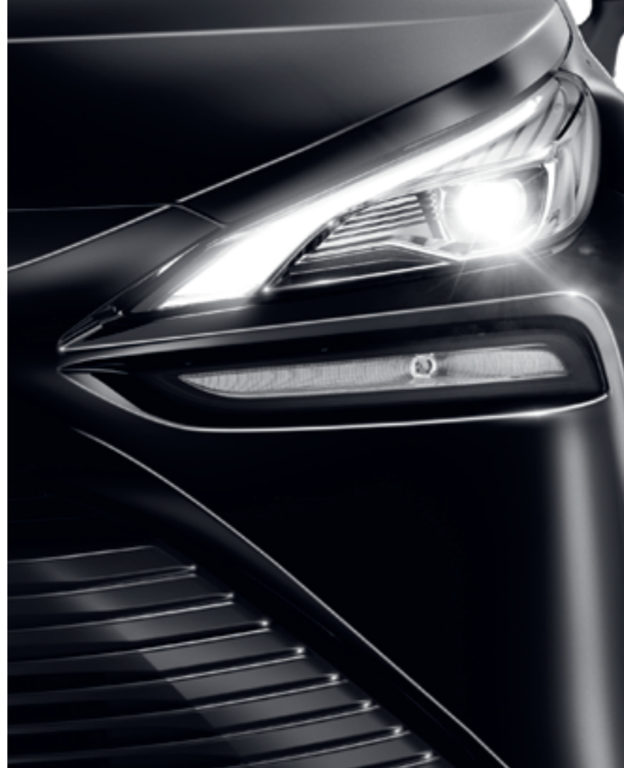
Elegante LED-Scheinwerfer inklusive Fernlicht-Assistent leuchten die Straße jederzeit optimal aus